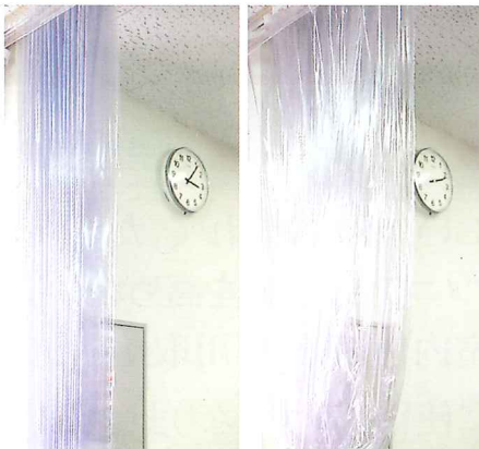
▲《アキレスオレール》はコンパクトに収納できます。